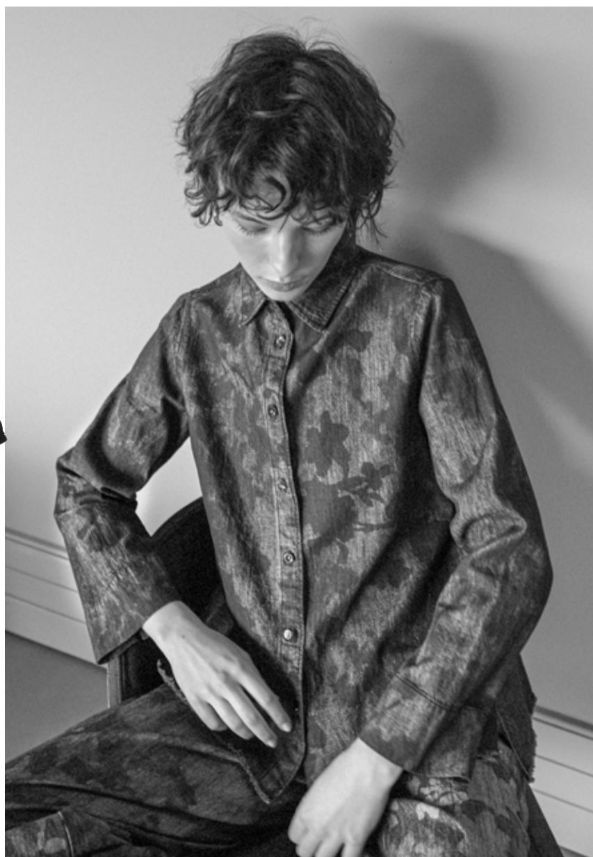
Alcune immagini della collezione FW 24/25 di YC

La collezione YC è in continua evoluzione. La ricerca dei materiali ha portato ad ampliare la collezione nel mondo del denim, mantenendo il dna del brand con una freschezza e un savoir faire sartoriale. La collezione denim si integra perfettamente con i capispalla, la maglieria e la collezione di camicie. La donna YC è una donna contemporanea, ama l'eleganza, ama sentirsi sicura di sé nella sua quotidianità e non solo nelle occasioni speciali. Le proposte vedono protagonista la tela sia in versione tinta unita che in versione stampata: una serigrafia hand made realizzata in Italia, disponibile in due varianti colore. Il denim utilizzato nella collezione è un tessuto di altissima qualità, completamente made in Italy e certificato GOTS. Una stoffa ricercata, con caratteristiche luxury che conferiscono al prodotto una mano morbida e un grande comfort. Capi timeless caratterizzati da volumi che esaltano la silhouette di ogni corpo. La capsule è composta da diverse tipologie merceologiche: due modelli di camicia, una polo, un abito, due pantaloni e una gonna.